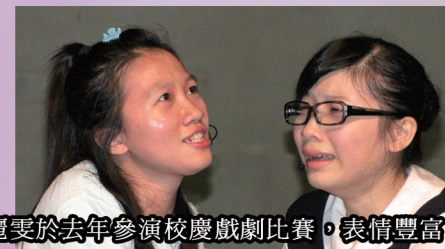
麗雯於去年參演校慶戲劇比賽，表情豐富

留心曾留學外國的朋友及外藉老師的英語口音，所以在唸作品時，我十分注重發音細節。就好像評判在比賽後指出很多參賽者在讀「butterfly」時，忽略了「r」音，我卻沒有犯這個錯誤。」常言「魔鬼」在細節，其實「勝利之神」也在細節。