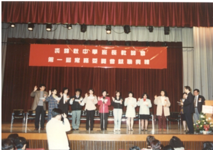
家教師會--第一屆常務委員會就職典禮