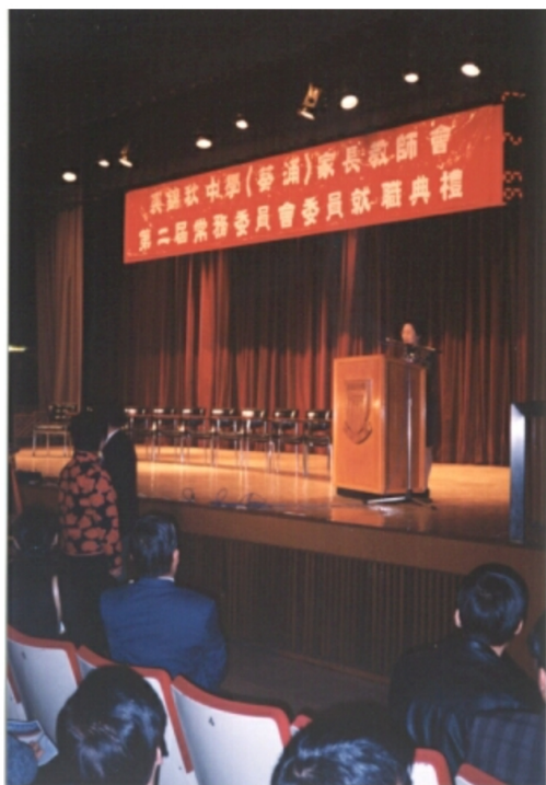
家長教師會--第二屆常務委員會就職典禮