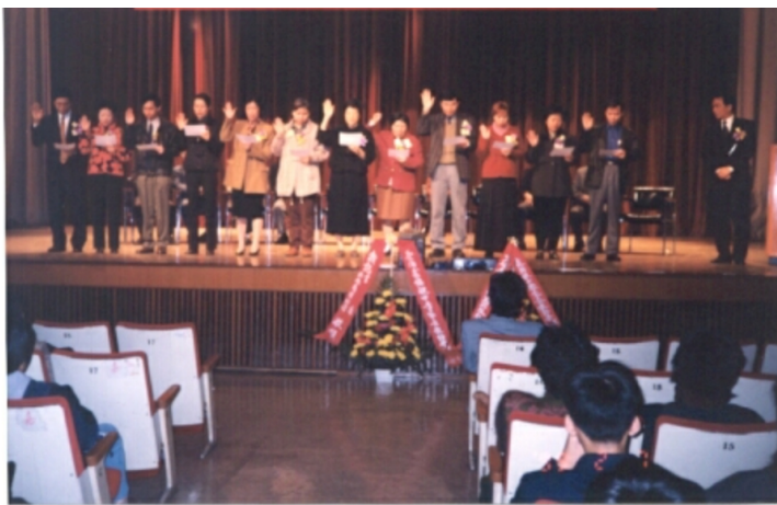
家長教師會--第二屆常務委員會就職典禮