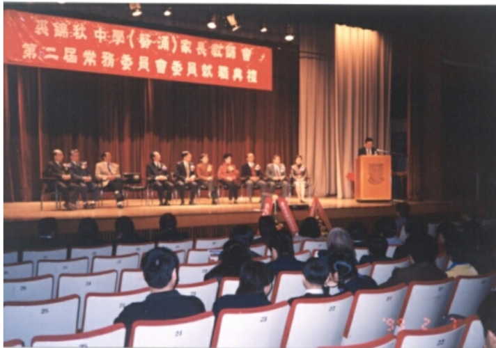
家長教師會--第二屆常務委員會就職典禮